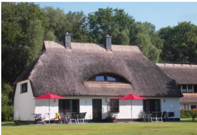
Außenansicht, rechte Terrasse „Boddenbarsch“