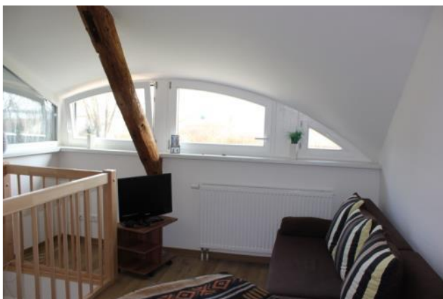
Galerie mit Wasserblick