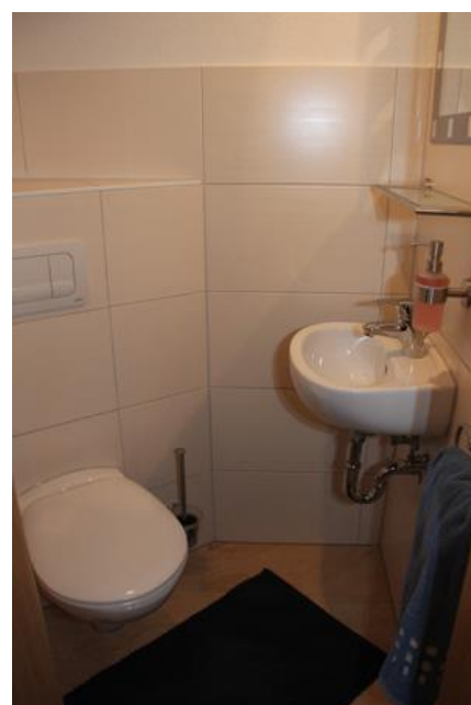
kleines Bad im Flussbarsch

Wir wünschen Ihnen einen erholsamen Urlaub!