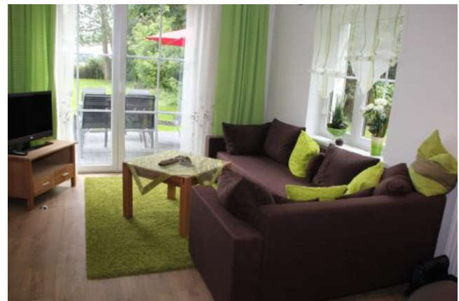
Wohnzimmer mit Zugang zur Terrasse