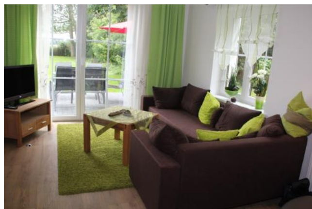
Wohnzimmer mit Zugang zur Terrasse