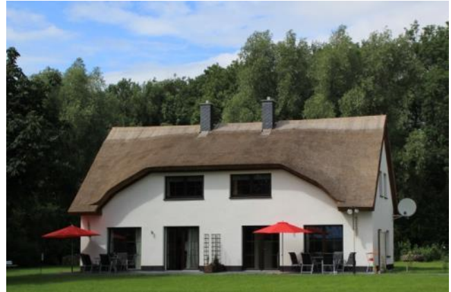
Außenansicht, linke Terrasse „Grüner Plötz“