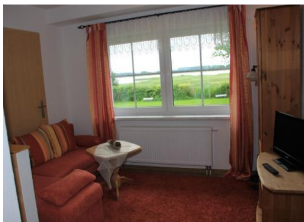
Galerie mit Wasserblick