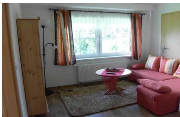
Galerie mit Wasserblick