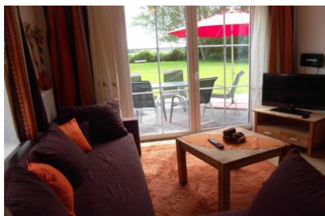
Wohnzimmer mit Zugang zur Terrasse