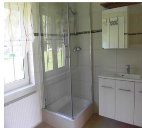
Badezimmer im Erdgeschoß

Wir wünschen Ihnen einen erholsamen Urlaub!