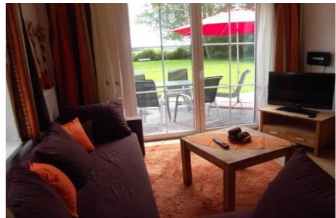
Wohnzimmer mit Zugang zur Terrasse