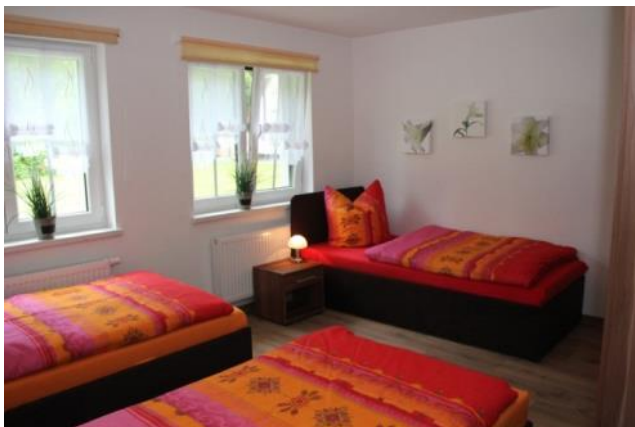
Schlafzimmer für 3 Personen