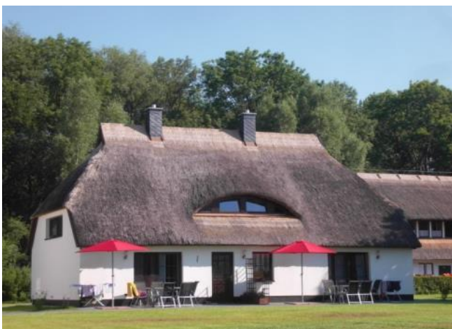
Außenansicht, linke Terrasse „Flussbarsch“