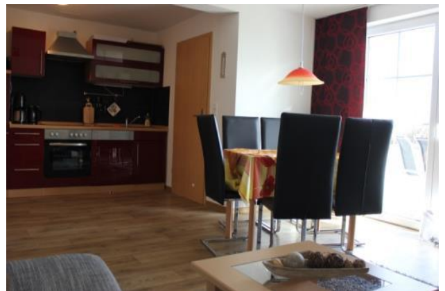
Küche im Flussbarsch