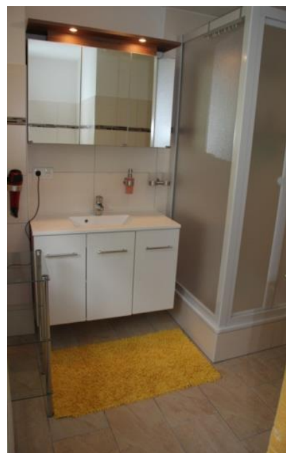
großes Bad im Flussbarsch