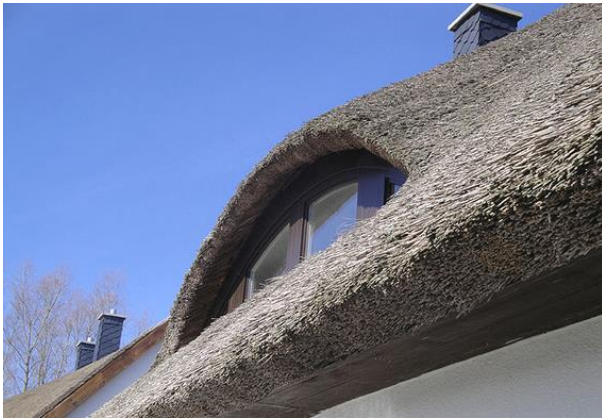
Blick auf das Haus „Barsch“

Neben dem Wohn- und Essbereich finden Sie zwei großzügige Dreibettzimmer, ein großes Bad mit Dusche und eine separate Toilette.