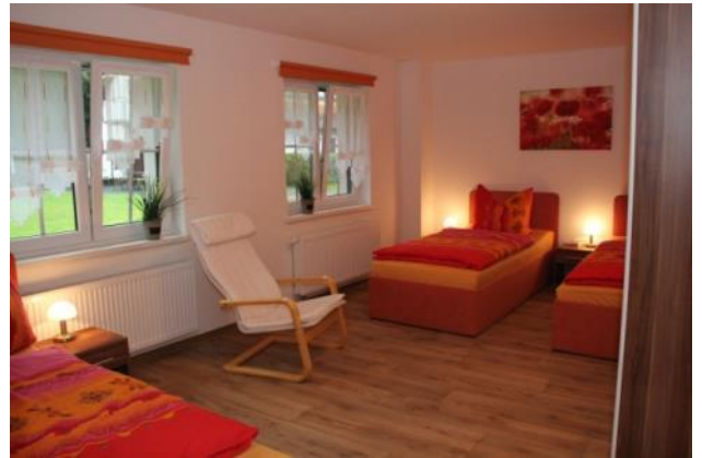
Schlafzimmer für drei